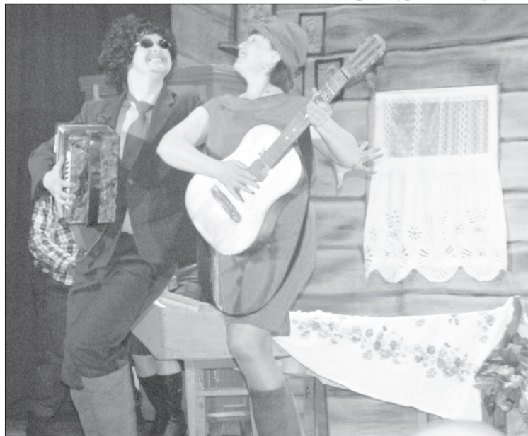
Сцена из спектакля «Шутки в глухомани».

Прилузские театралы уже второй раз принимают участие в данном фестивале. В прошлом году они впервые представили на суд взыскательного петербургского зрителя и жюри пьесу «Марьино поле» Олега Богаева, которая была приурочена к 70-летию Победы в Великой Отечественной войне. По итогам Объячевский народный театр стал лауреатом второй степени. Для прилузской труппы, которая впервые выступала на фестивале