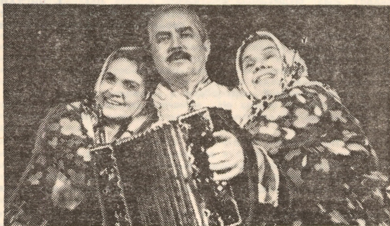
НА СНИМКАХ: сцены из спектаклей последних лет.

2 февраля... шла комедия Островского «Не в свои сани не садись» и в заключение водевиль с пением «Гамлет Сидорович и Офелия Кузминична». Спектакль прошел очень дружно, с хорошим ансамблем...»