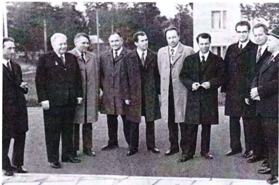
Партийные работники на даче в Лемью под Сыктывкаром