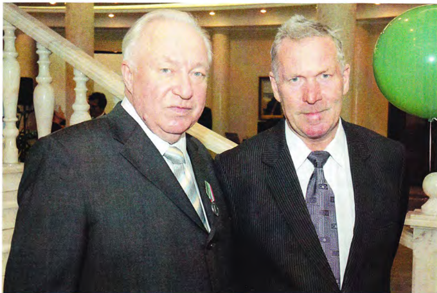
С братом Юрием