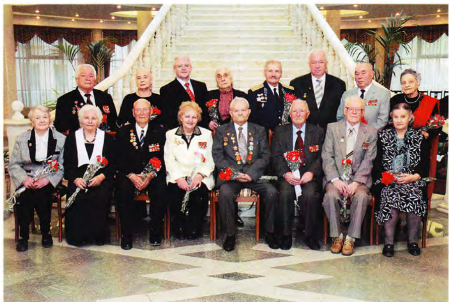
С ветеранами Великой Отечественной войны в Представительстве РК в Москве