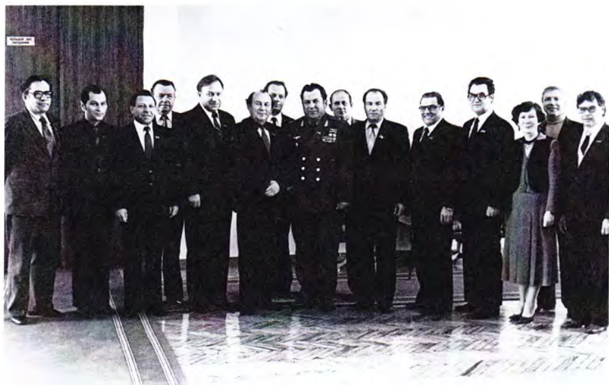
Визит в республику летчика-космонавта Павла Поповича, 1982 год