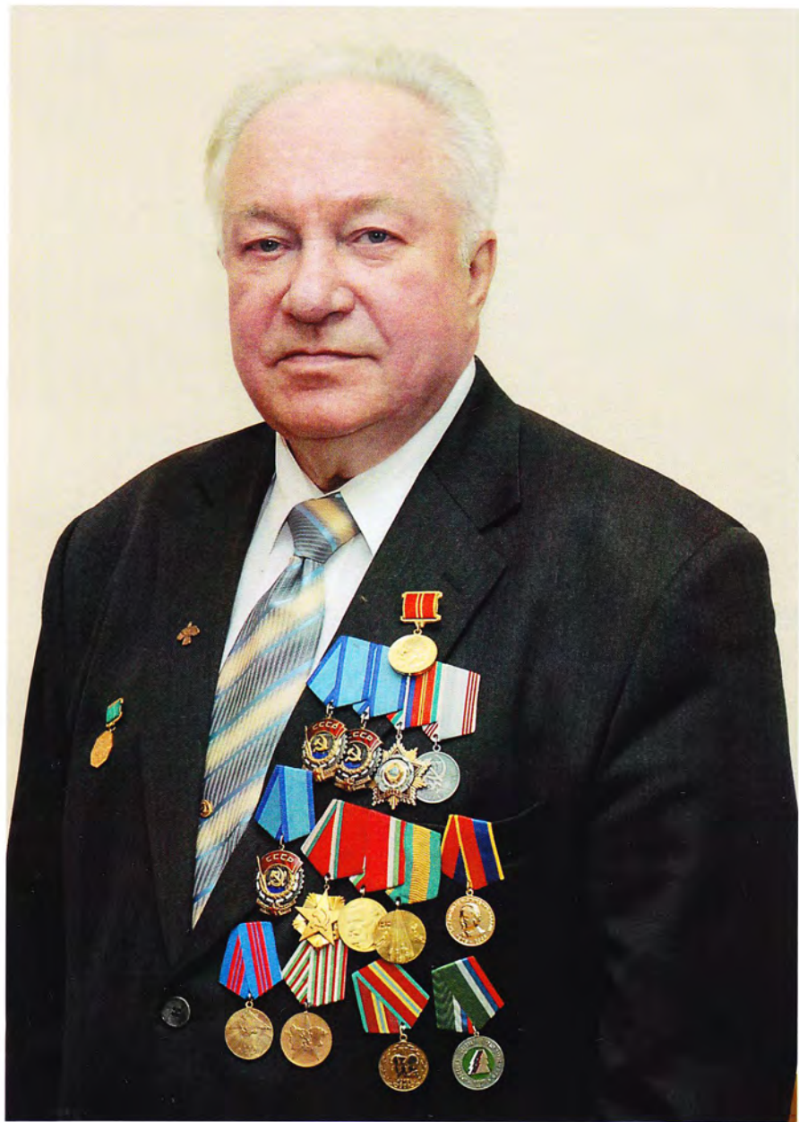
При полном параде