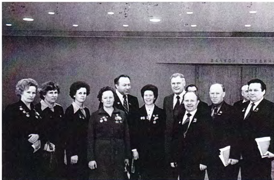
В составе делегации на XXVII съезде КПСС, Москва, 1986 год