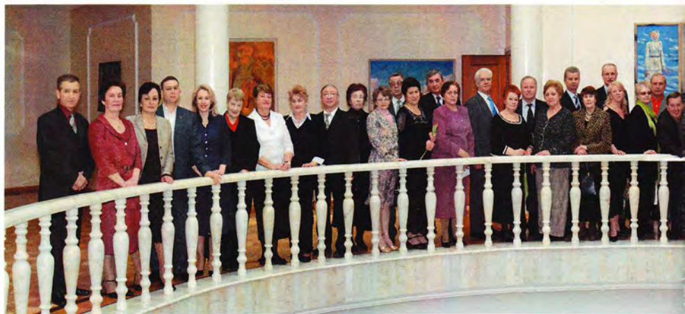
Встреча членов «Землячества Коми» в Москве, 2006 год