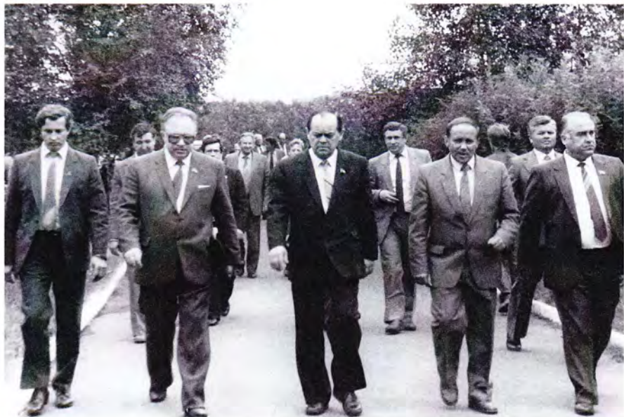
Визит на Сосногорский газоперерабатывающий завод члена ЦК КПСС Б. Е. Щербинь