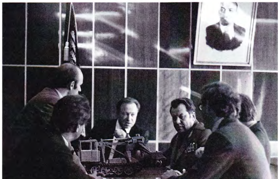
Встреча руководства Сыктывкарского механического завода с летчиком-космонавтом Павлом Поповичем, 1982 год