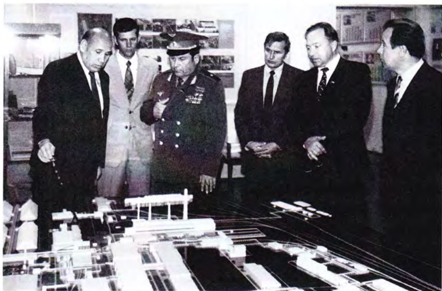
Встреча руководства Сыктывкарского ЛПК с летчиком-космонавтом Павлом Поповичем, 1982 год