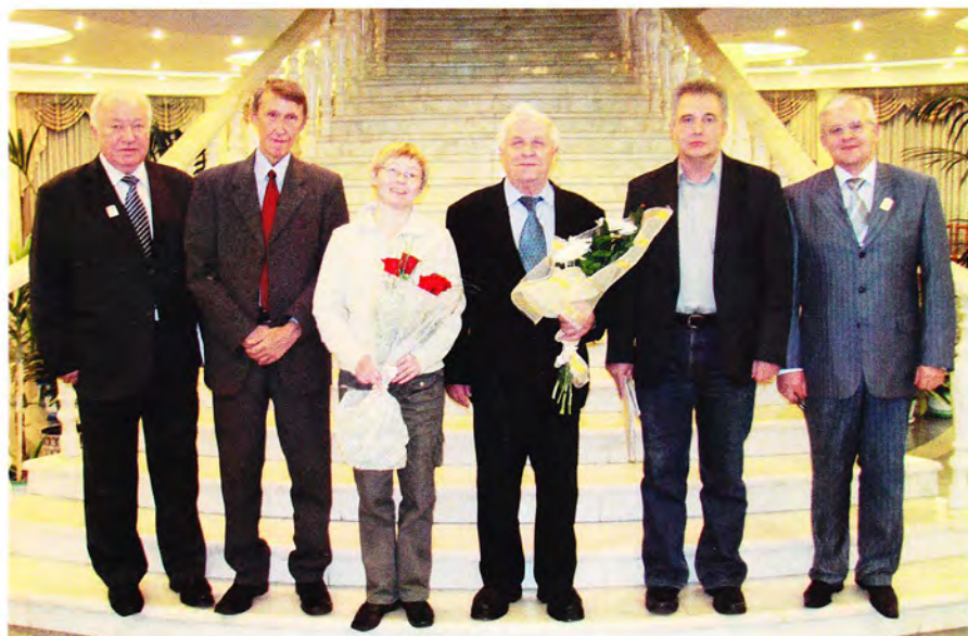
Встреча с земляками, известными писателями Республики Коми