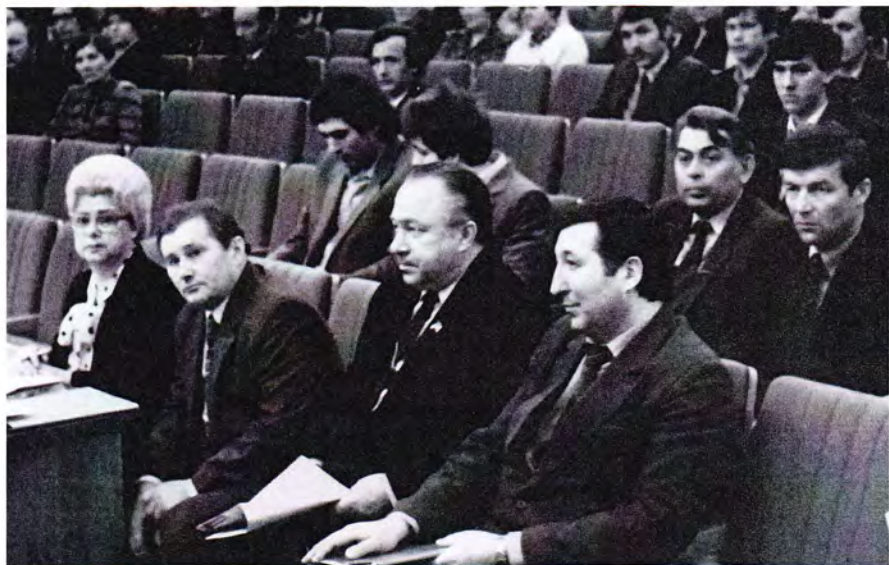
На заседании сессии Верховного Совета Коми АССР. Июль, 1986 год