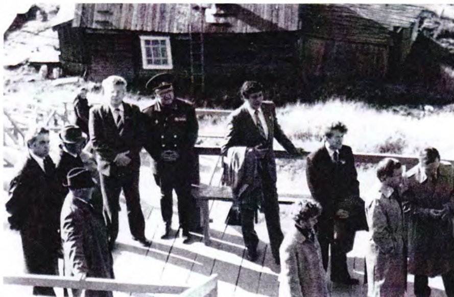
Рабочие поездки. В городе Печоре