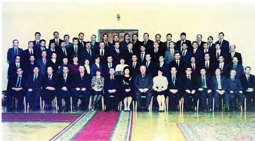
XXVII Коми областная партийная конференция, 1988 год