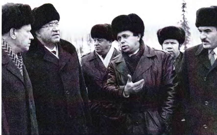
Рабочая поездка в Усинск