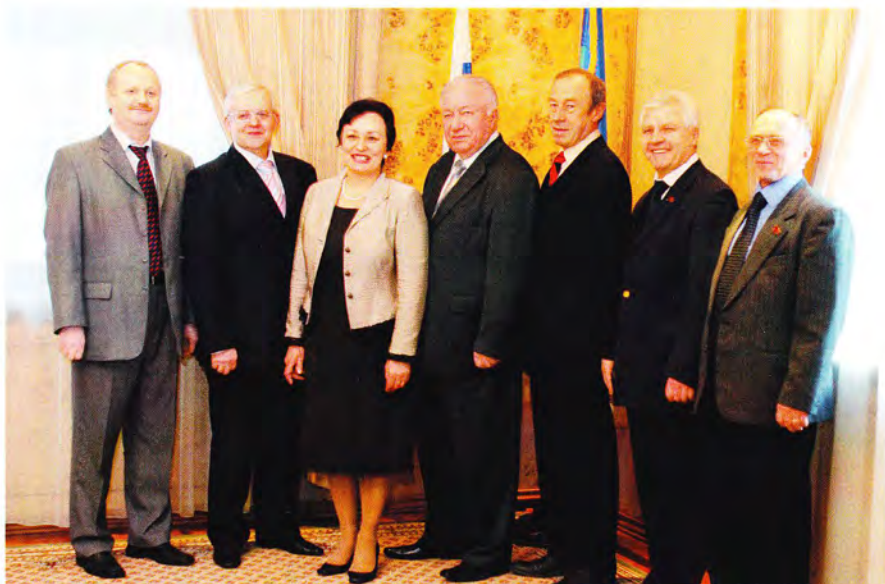
Встреча с народными депутатами СССР