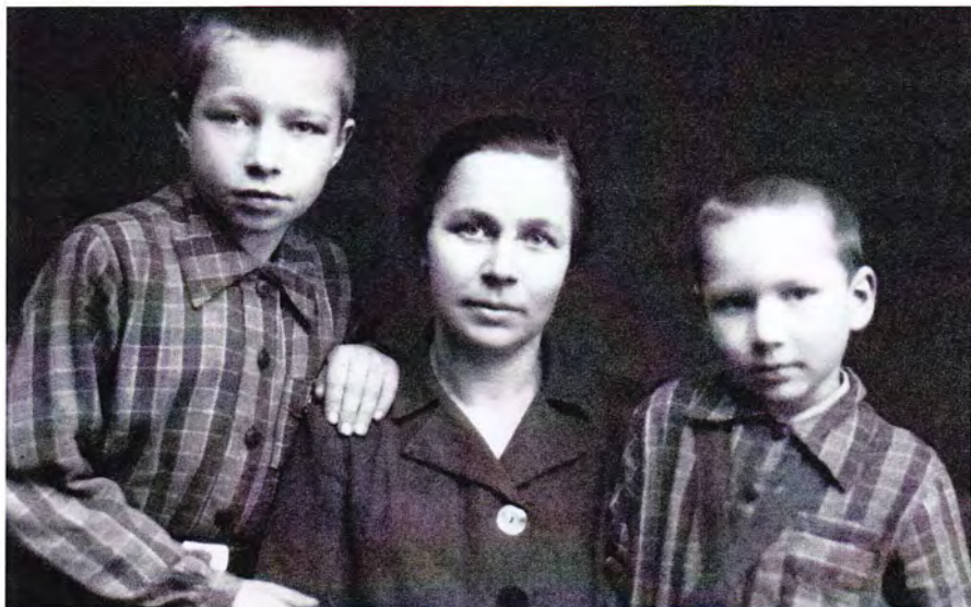
С мамой и младшим братом, 1943 год