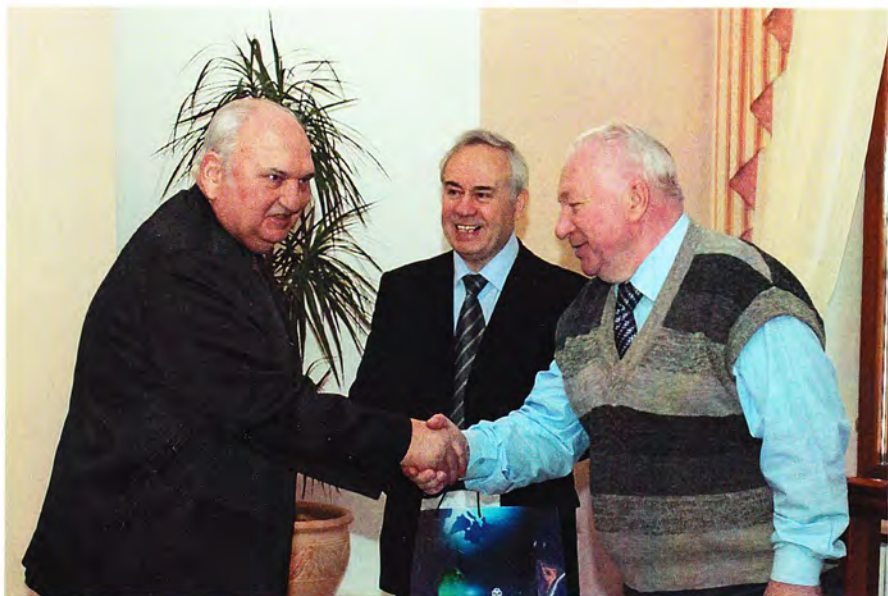
В усадьбе Остафьево