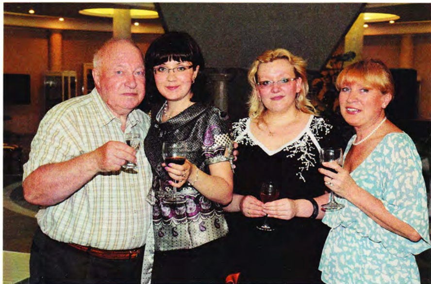
С активистами «Землячества Коми», 2008 год