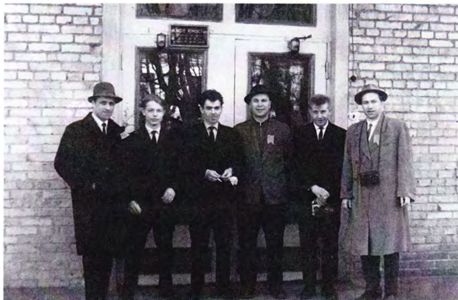
С коллегами — на первомайскую демонстрацию, Сыктывкар, СМЗ, 1964 год