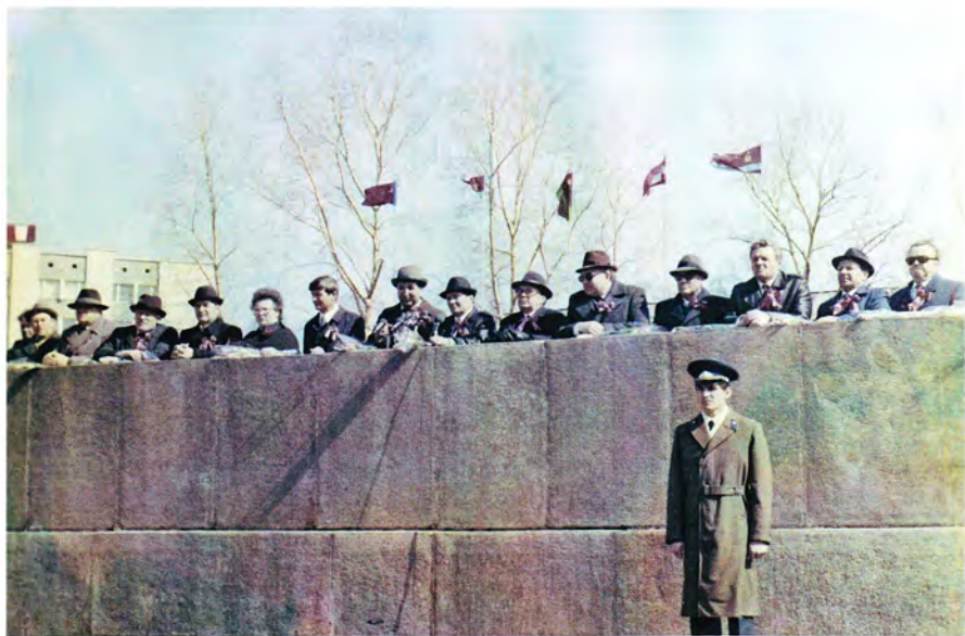
Первомайская демонстрация. 1985 год