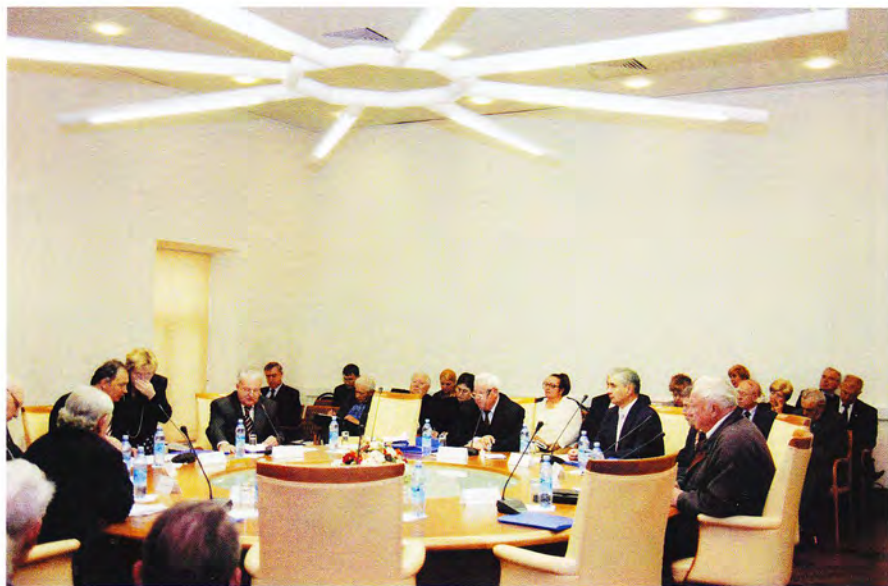
Заседание координационного совета региональных землячеств. Москва, 2003 год