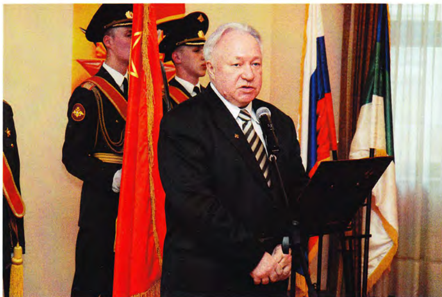
День Победы в Представительстве РК в Москве