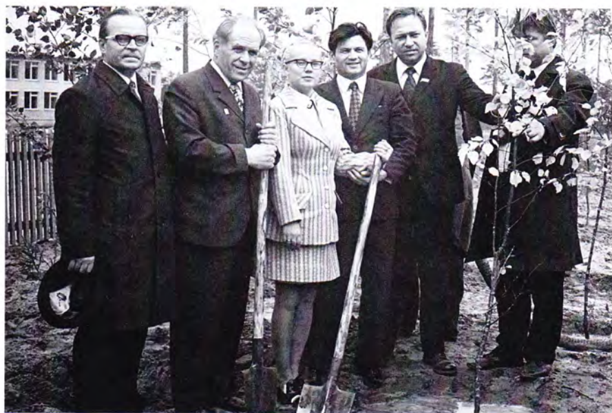
На традиционном коммунистическом субботнике