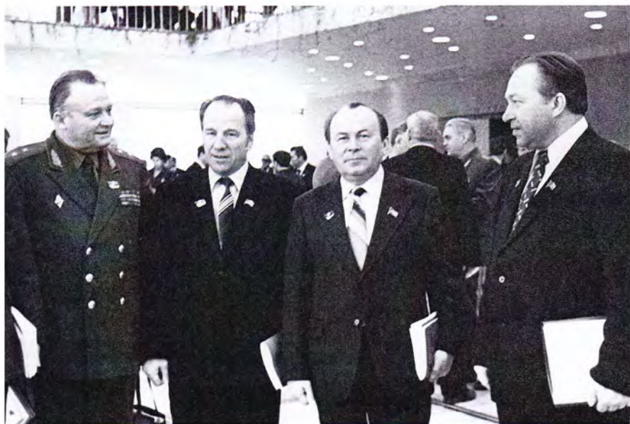
В составе делегации на XXVI съезде КПСС, Москва, 1981 год