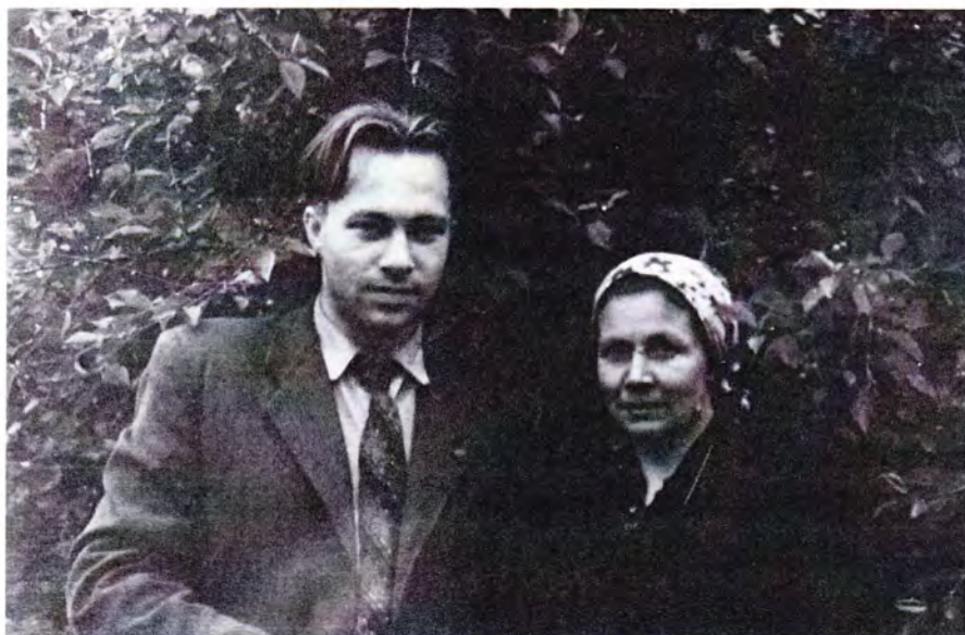
Владимир с мамой в городе Александрове после окончания института, 1958 год