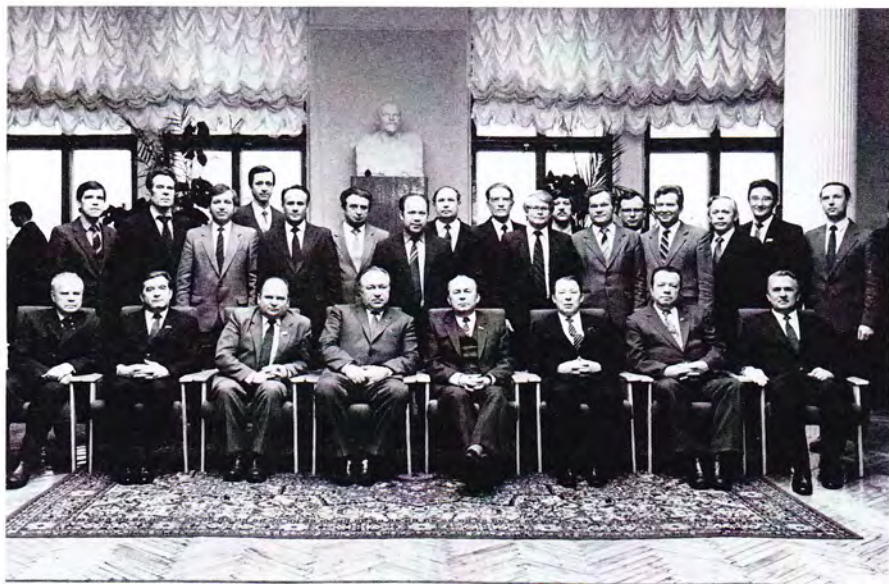
Сотрудники аппарата Коми обкома КПСС, 1987 год