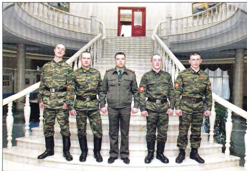
Группа воинов из Коми