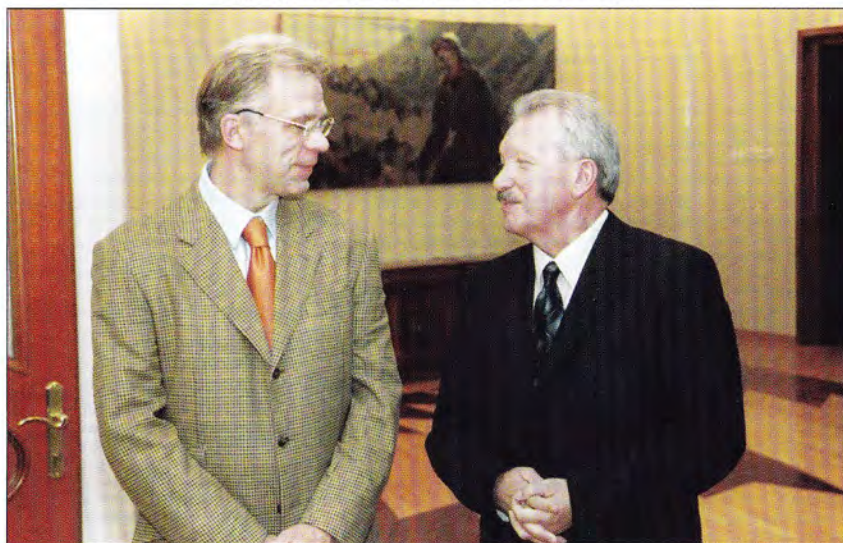
Председатель Госкомитета по делам культуры и спорта РФ В. А. Фетисов