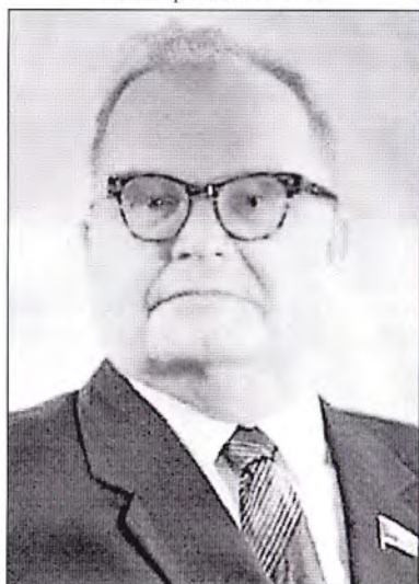
В. Н. Старовский – начальник Централь- ного статистического управления СССР