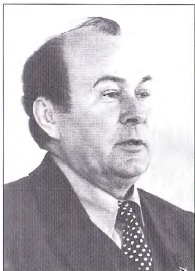
И. П. Морозов – Первый секретарь обкома КПСС