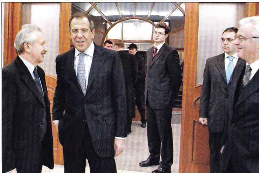
Министр иностранных дел России С. В. Лавров