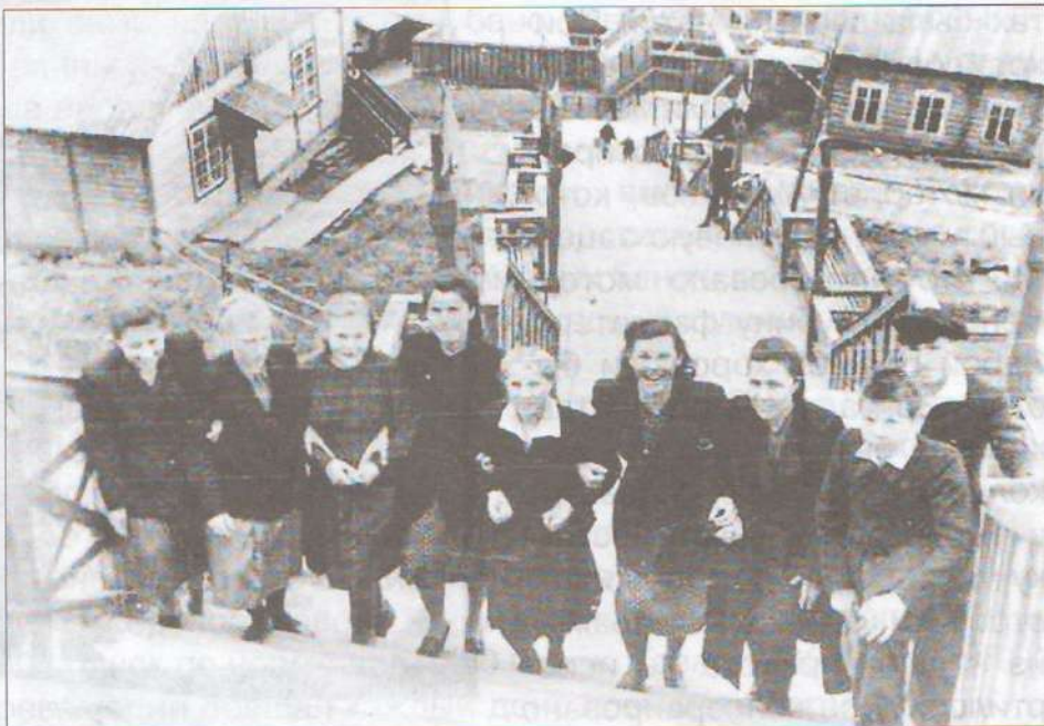
Знаменитая лестница в Усть-Усе.

Д ОСТАВКА рыбы и мяса до места назначения была сопряжена с многочисленными трудностями. В газете «Социалистический Север» в 30-е годы увидела свет статья, рассказывающая о нелегком пути одной из бригад от Харьяги до Усть-Усы. «До забойного пункта Харьяга-вом доехали за четверо суток. Ехать