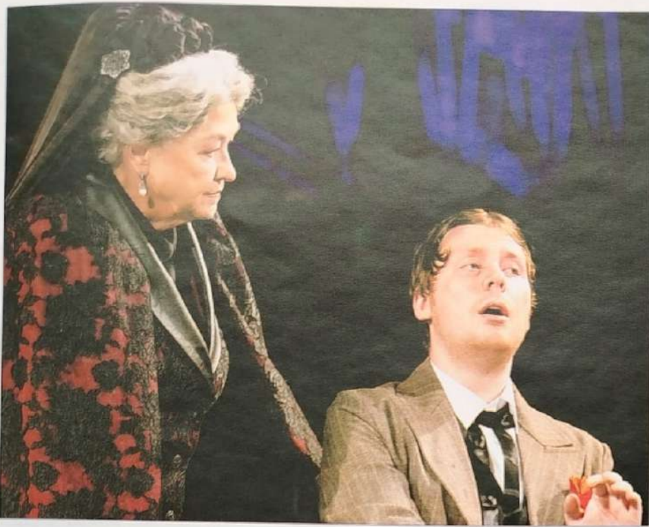
Мурзавецкая («Волки и овцы»)