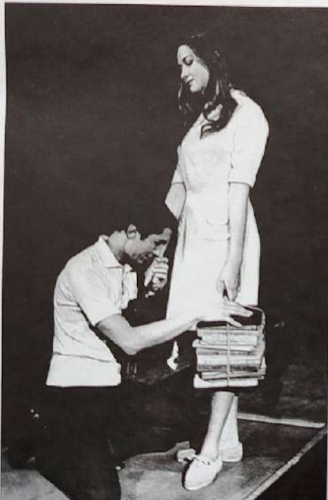
Валентина («Валентин и Валентина»)