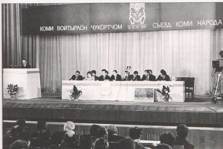
Исторический I съезд коми народа. Январь 1991 г. Члены Комитета возрождения коми народа. 1991 г. (внизу).

– Совет Министров Коми АССР зарегистрировал новое общество, и один из учредителей «Коми котыр» – ИЯЛИ