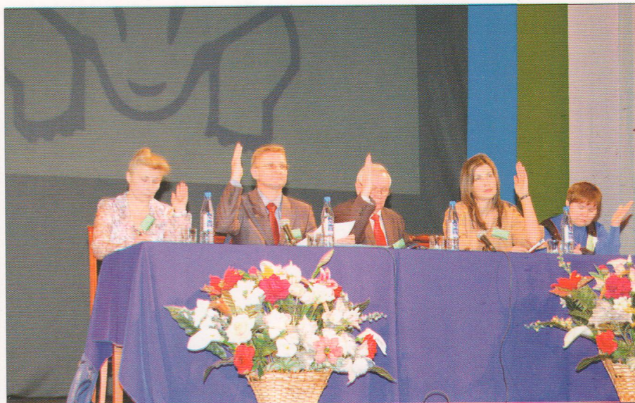
X съезд коми народа. 2012 г.