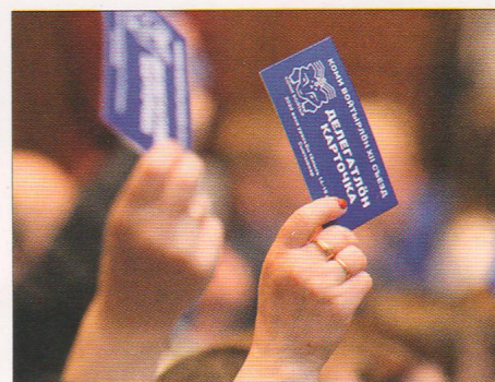
XII съезд коми народа в феврале 2020 г. успели провести до пандемии.